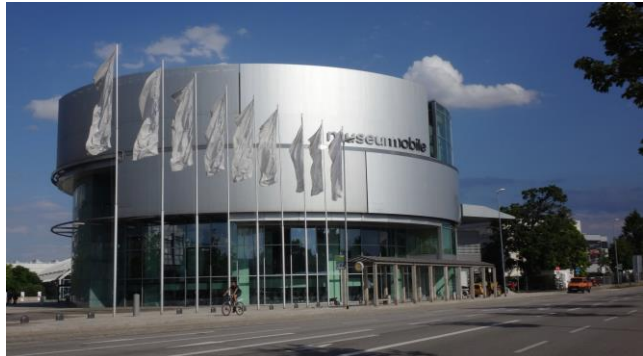
"Ingolstadt e il museo dell' AUDI"

Nel museo si racconta la storia della nascita del prestigioso marchio tedesco, con esposte auto, motociclette e auto da corsa e rally. Partecipiamo così alla visita guidata (costo € 4,00 a persona) in tedesco (è possibile anche in inglese, ma si può anche girare singolarmente), fortuna che i nostri compagni di viaggio ci hanno fatto da interprete. Rientrati in campeggio