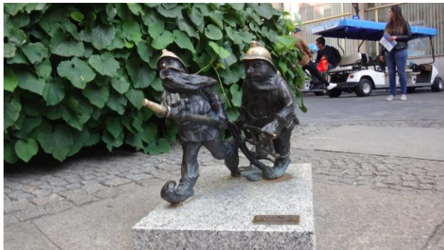
“ Breslavia ”