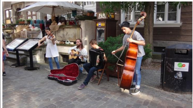
“artisti di strada a Danzica”