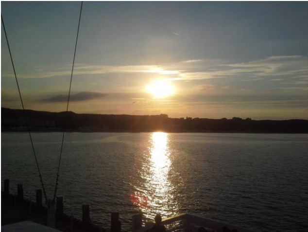
“tramonto su Danzica”