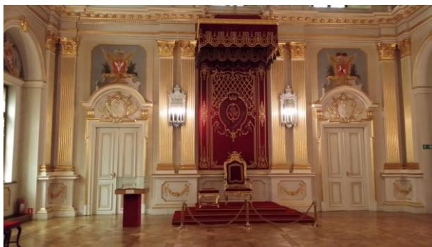
“Castello Reale: gli interni”