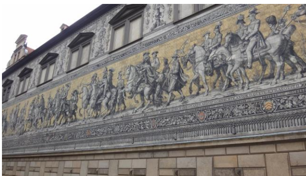
“ Dresda ”