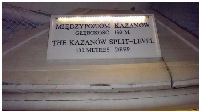
“Wieliczka e le miniere di sale”