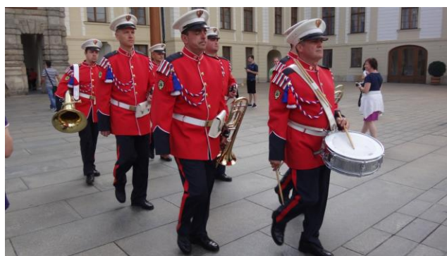
"Praga il Castello Reale e il cambio della guardia"