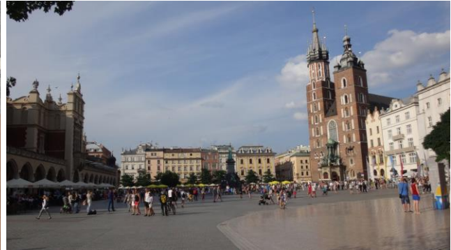
“La Chiesa di Santa Maria”