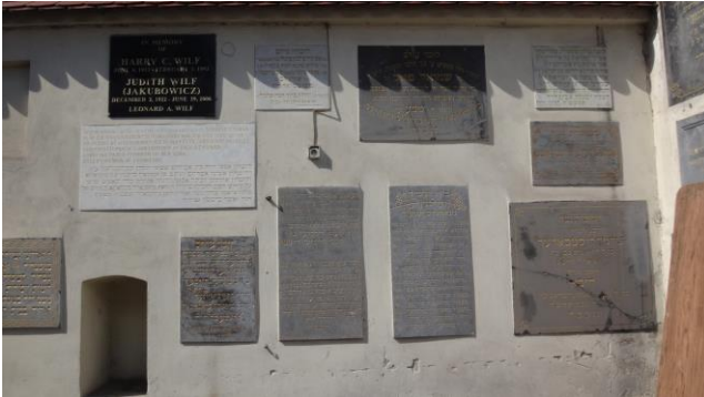
“Quartiere Ebraico: la Sinagoga”

È ormai ora di pranzo e ci dividiamo in piccoli gruppi in diversi locali per il pranzo, infatti la piazza è piena di locali di ogni tipo e gusto! Noi andiamo al “Café Restaurant Europejska” www.europejska.pl . L'appuntamento con Magda è per le 14,30 sotto la torre della “ Chiesa di Santa Maria ”. Torniamo così al nostro bus che ci porterà nel “ Quartiere ebraico ”, dove giriamo per le vie del quartiere e visitiamo la “ Sinagoga di Remuh ” con il suo “ Cimitero ”. Le “ Sinagoghe ” sono quattro: la “ Sinagoga Alta ”, la “ Sinagoga di Isacco ” e la “ Vecchia Sinagoga ”. Al termine della visita il bus ci riporta nei pressi della piazza grande dove abbiamo tempo libero per gli eventuali acquisti. Va ricordato che “ Cracovia ” ( Krakow ) è la città dove “ Papa Giovanni Paolo II ” ha completato gli studi ed è stato vescovo per 12 anni, ma la sua città natale è stata “ Wadowice ” nei “ Carpazi ”. Rientriamo al campeggio per le 19,00. Cena tutti insieme, approfittando del bel tempo.