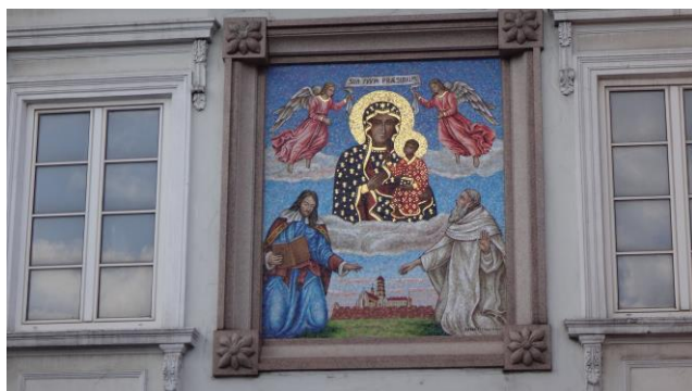
““Il Santuario di Jasna Góra a Czestochowa””