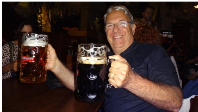
“Aperitivo di inizio viaggio e a cena con ottima birra”