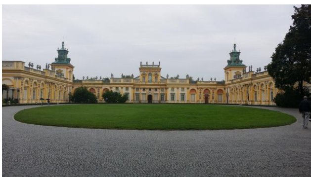
“Il Parco LAzienkowski il Teatro Reale”